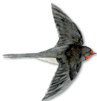
Dessus entièrement sombre