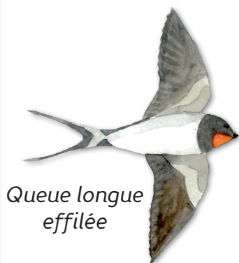
Queue longue effilée

Elle est à la fois plus citadine et plus montagnarde que sa cousine. Elle aussi a un plumage noir dessus et blanc dessous, mais se distingue par sa gorge et son croupion tous blancs.